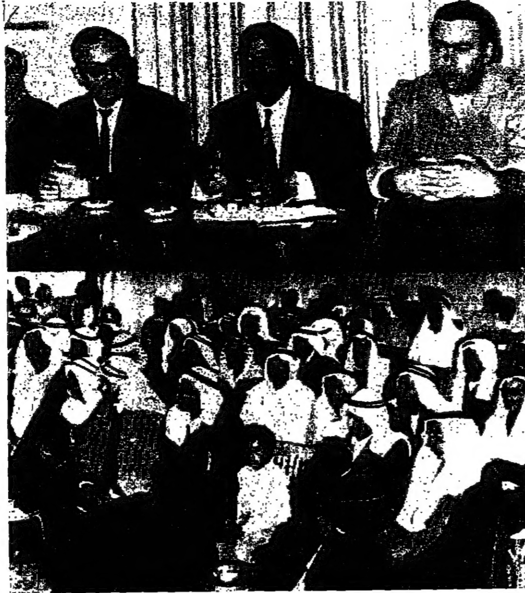
متصرف لواء الزرقاء ومدير الشرطة يتصحبون إلى المختار لجلسة الاجتماع الذي عقد في قاعة المفردة بصحبة